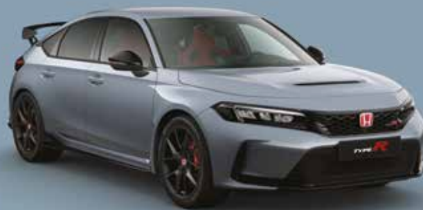
SONIC GREY PEARL