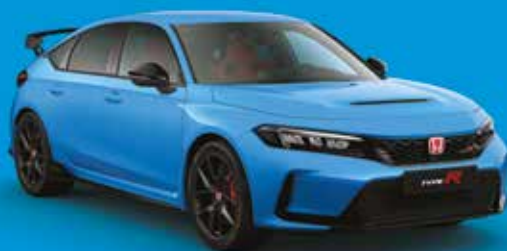
RACING BLUE PEARL